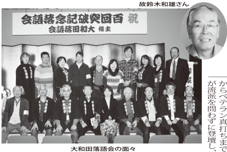
大和田落語会の面々