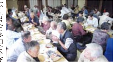
会話もごちそう。昨年の「いも煮会」

同会では定年になるまで地域社会とのふれあいや体験の少ない市民に「ネットワークづくり」や地域の仲間との活動の中で「新しいライフスタイル」が生まれることを目指し、