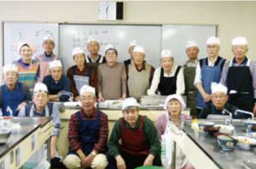
料理が完成してホッと一息の「おやじの料理」参加者

船橋市時活村サロン「おやじの料理」に参加してきた。船橋市中央公民館調理室で月1回開催。今回の参加者は19名、1班4名編成で会費は1500円だ。最初に材料と作り方を記述した「4月のおやじレシピについて」が配られた。