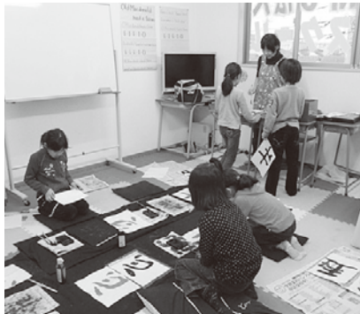
希望者には書道の指導もある

市川市若宮三丁目に4 月1日、NPO法人アフ タースクール若宮教室が オープンした。放課後小 学生を預かる民間の学童 スタッフが車で小学校まで 児童を迎え、帰りに各家庭 の要望にあわせた時間 で送り届けること。私 立校に通う子どもの家 庭も利用で