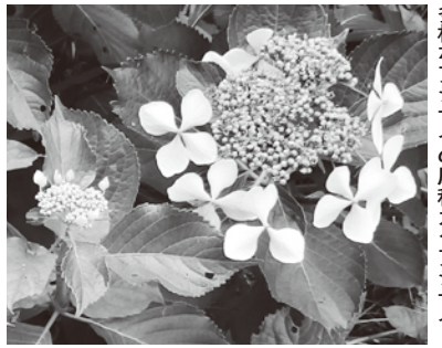
多様なアジサイの原種、ガクアジサイ

梅雨の花といえばアジサイ。我が家のベランダにも鉢植えのアジサイが数株ある。ただ花をつけるのは毎年1、2の枝のみ。アジサイの花は2年目の枝につくが、花が終わると日陰のところが盛んに枝葉を伸ばす。この伸びた枝葉を切ってしまうと翌年は花が見られなくなってしまう。アジサイは世界中で栽培されて多くの品種が知られ、セイヨウアジサイとよばれるものもある。しかしそのアジサイの原種、実は房総半島から伊豆半島、伊豆諸島などの暖地の海