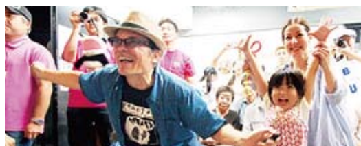
スーパーフォトセッションでのブルース氏