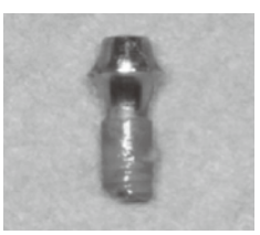
破折したインプラント

しかし、中には第三の歯どころか痛い目にあっただけの患者さんも多々いるのである。インプラントの周りが炎症を起して