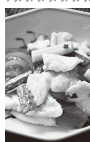
きゅうりと鶏胸肉の炒め物

暑い夏の日、ぱりっと思えるきゅうりは火照った体を冷まし、水分を補給してくれます。現在、流通しているきゅうりの長さ、どのように基準が決められたかご存知ですか。お寿司屋さんのかっぱ巻きの海苔の長さに合わせて決めたと決めているとか。本当はもう少し大きい方が、味がしっかりして美味しいのだそうです。規格外のちょっとと不格好なきゅうりと出合ったぜひ味を確かめてください。