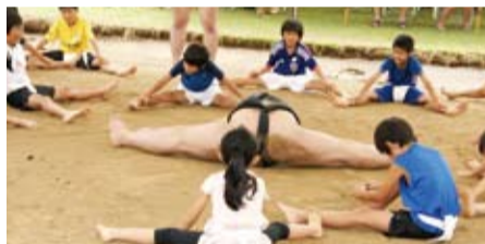
股割りの稽古に苦戦する参加の子どもたち

印旛郡栄町のふれあい公園に特設された土俵上で先月6日から千賀ノ浦部屋の夏合宿が行われ、最終日の10日、「ふれあい体験相撲」が開催された。20人中5人が千葉県出身者からなる千賀ノ浦部屋は、昨年に続き、同地で2度目の夏合宿。力士たちは合宿中、朝7時から10時頃までぶつかり稽古などで汗を流し、9月場所に向けて体づくりに励んだ。 同町出身で十両の舁ノ山関はけがの治療で残念ながら途中から不在となったが、身長180センチ、体重150キログラムを超える力士には強いオーラが感じられ、見ている者に元気と勇気を与えていた。見学者の中には女性の姿も数多く見られた。