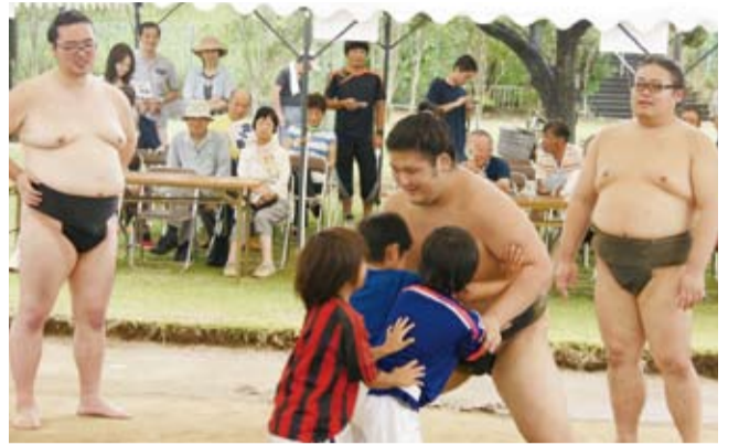
3人がかりでもかなわない。お相撲さんは強いぞ!