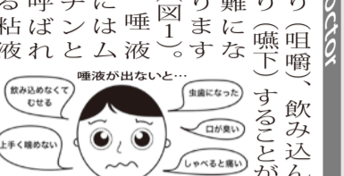
図1 ドライマウスの問題点

唾液は口腔内の免疫を担う大事な体液ですが、その役割は唾液だけではありません。唾液が少なくなると、食物を噛んだ