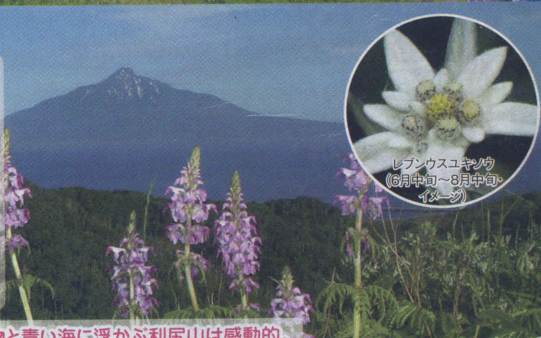
レブンウスユキソウ (8月中旬～8月中旬イヤーソウ)

歩けばその足元に咲くたくさんの高山植物に歓迎され、6月中旬から8月中旬は礼文を象徴する花・レブンウスユキソウの群生地も見学できる見どころいっぱいのコース。同じ散策路を往復する中で花を見逃す確率が低い充実した散策となるでしょう。 ●行程 / 林道入り口～レブンウスユキソウ群生地 ●歩く道 / 未舗装ですが歩きやすい道です ●高低差 / 約50メートルありますが、歩きやすく配慮された散策路なので安心 ●歩く時間 / 約120分 ●歩く距離 / 往復約4km ※上記は目安です。花の開花状況により時間と距離は前後します。