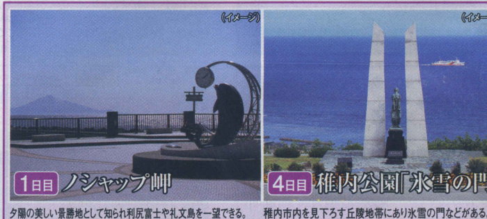
1日目 ノシャップ岬