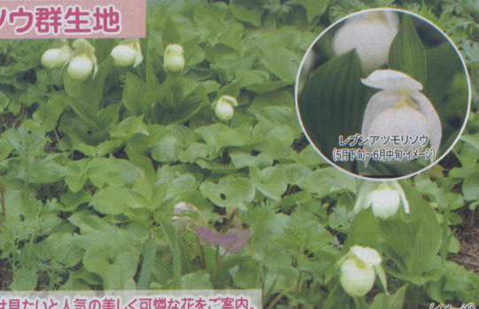
レブンアツモリソウ (5月下旬～6月中旬イヤーソウ)

特定国内希少野生植物種に指定されている世界中で礼文島にしか自生しないラン科植物。その美しさや可憐さが人気を呼び、盗掘が絶えず、現在は24時間監視体制で見守られています。