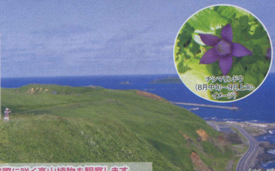
チシマヒレソウ (8月中旬～9月上旬イヤーソウ)

手前にトド島、晴れた日には遠くにサハリンを望める絶景の海岸美を眺めながらスコット岬をめざして歩きます。舗装されて歩きやすい散策路の左右には可憐に咲く高山植物を手に取るように間近で見ることが出来ます。 ●歩く道 / 平坦なアスファルトの舗装道路 ●高低差 / ゆるやかな下り坂が多いので楽に歩けます。