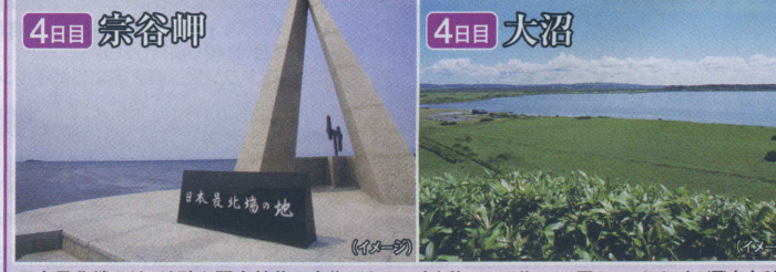
日本最北端の地。地碑や間宮林蔵の立像がある。春と秋には1日約5,000羽のコハクチョウが飛来する。