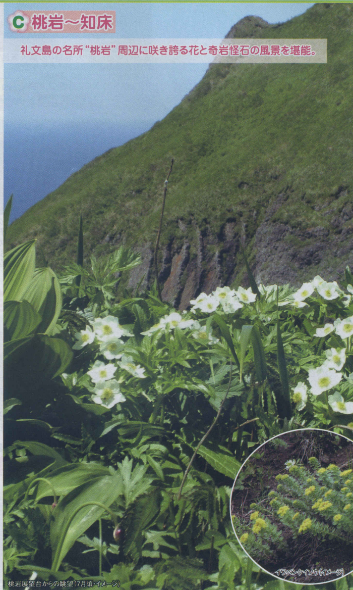
桃岩展望台からの眺望(7月頃・イメージ)